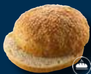
Cafébolle m. sesam, skåret

40 stk. á ca. 115 g Pris pr. stk.: 3,23 12900 pr. krt ..... Varenr. 3606 ❄️ 🍳 🌱