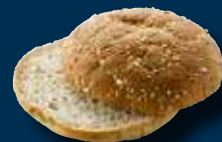
Grove Buffalo Burgerboller, skåret

48 stk. á ca. 90 g Pris pr. stk.: 2,75 13200 pr. krt ..... Varenr. 1100 ❄️