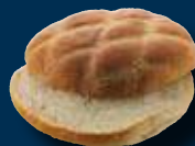
Buffalo Burgerboller, skåret

35 stk. á ca. 100 g Pris pr. stk.: 3,69 12900 pr. krt ..... Varenr. 3961 ❄️